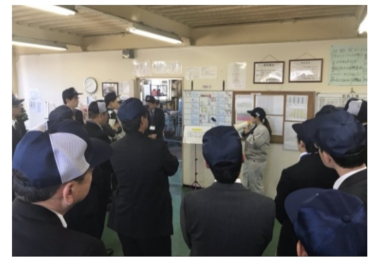
工場見学会 新島工場